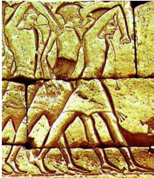
“Representación antigua de los filisteos, los enemigos de Israel”

“Jehová es; haga lo que bien le pareciere” (1 S. 3: 28)