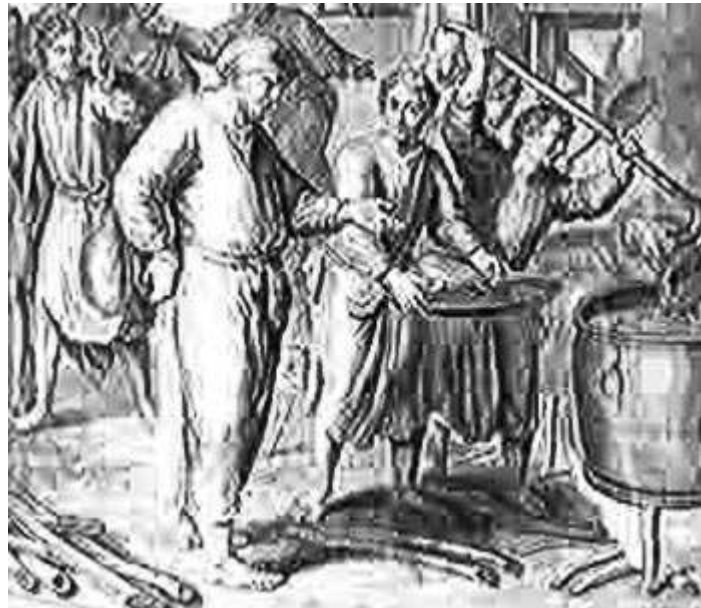
“Grabado que nos muestra la escena bíblica aludida”

Si el oferente se negaba (como era su derecho legítimo), entonces el sacerdote por medio de su enviado, le amedrentaba aprovechándose de su poder para actuar violentamente y conseguir su propósito. Al demandar la carne antes de ser ofrecida, se adelantaban al Señor y usurpaban Sus derechos.